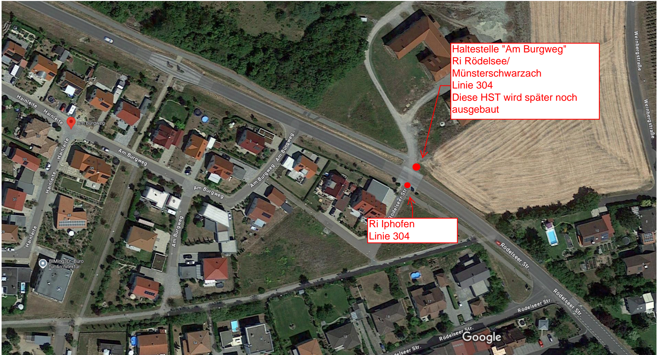
20 m